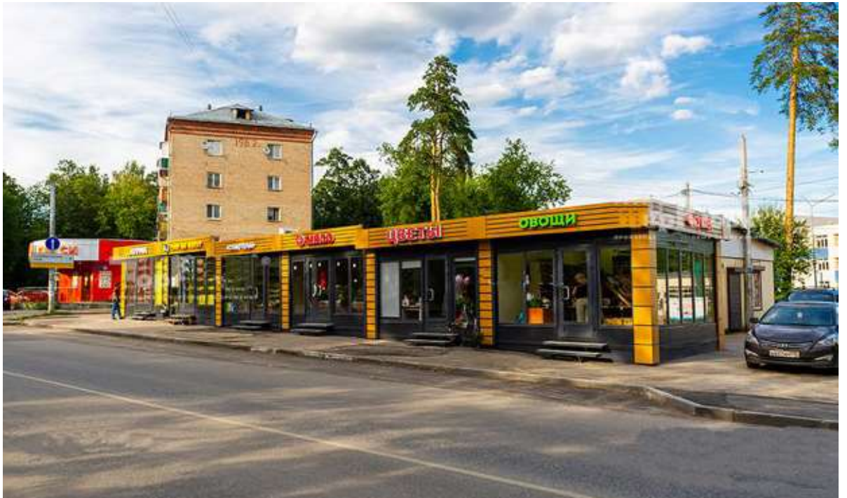
Орджоникидзе ( авторынок)